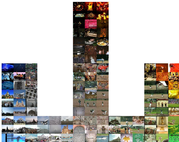
Flickr画像 × “山”フレーム