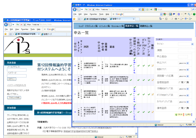
図 3: 新受付システムのスクリーンショット (申し込み画面と管理画面)。

プレ IT 時代に産声をあげた IBIS は、今や社会基盤を支える良質な基礎技術を提供するという役割を社会から期待される存在にまでなった。今我々は社会のフロンティアにいる。IBIS をめぐる環境はずいぶん変わったけれど、学習の理論を核とした学際理論フォーラムを作ろうとした IBIS の創立時の純粋な志は [1]、多くの人の